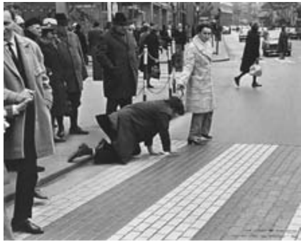
Aus der Mappe der Hundigkeit, 1969 Valie EXPORT, Peter Weibel 50 x 40,4 cm