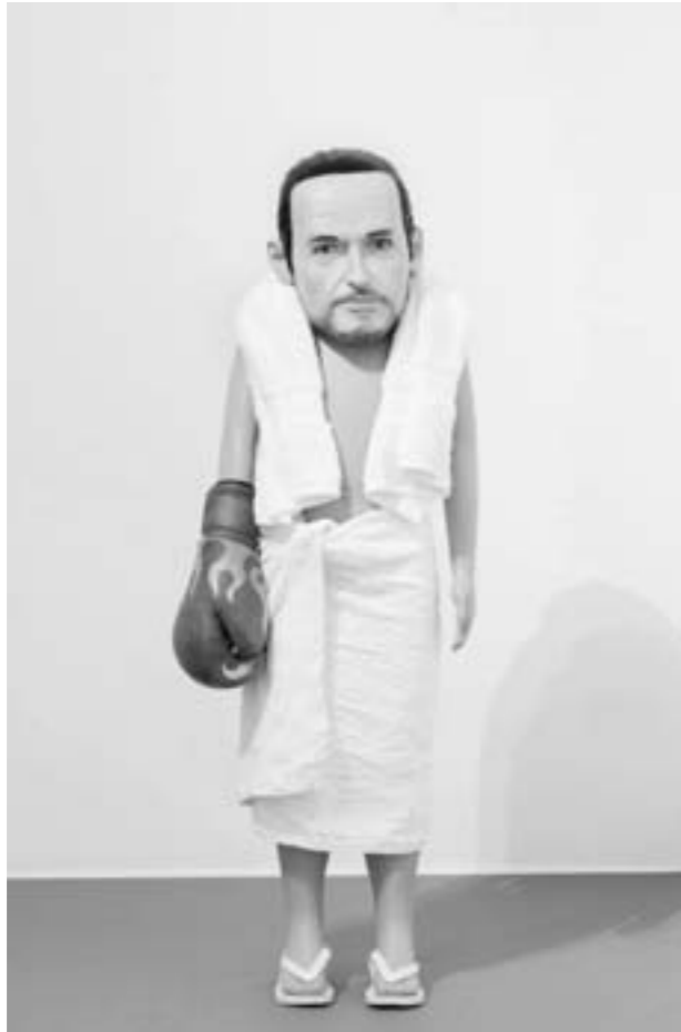
The Overman, 2012 littlewhitehead Schaufensterpuppe, Handtücher, Boxhandschuh, Holzsockel, 120 × 120 120cm