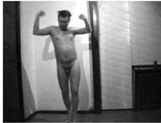
Peter Land d. 5. maj 1994, 1994 Peter Land Video, Farbe, Ton, 25 Min.

«Der Mensch spielt nur, wo er in voller Bedeutung des Wortes Mensch ist, und er ist nur da ganz Mensch, wo er spielt»