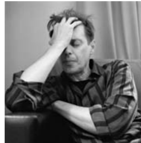
Steve Buscemi, 2004 Sam Taylor-Johnson C-Print, 99,2 × 99,2 cm