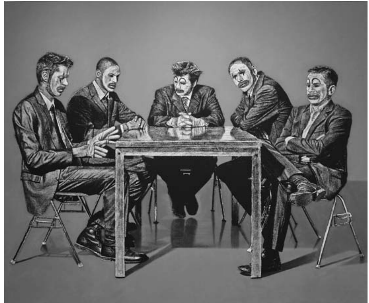
Enthusiasm, 2012 Acrylic on Canvas, 250 × 200 cm

Wieviel Zeit braucht es wohl noch, bis auch die lokale Kunstszene das Potential und das Talent des jungen Solothurners erkennt? Schwer beeindruckt verlassen wir das Atelier und verabschieden uns von Onur, der trotz seines Erfolges immer noch am Boden geblieben ist. Der kalte Herbstwind empfängt uns.