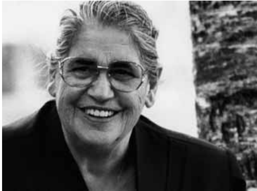
Mutter vor 20 Jahren

Vater und Mutter stammen aus armen, kinderreichen Arbeiterfamilien. Mutters Primarlehrer war seinerzeit zweimal zu ihr nach Hause gekommen und hatte ihre Eltern gebeten, die Tochter in die Sekundarschule zu schicken, das Rösi sei ein Geschicktes, das gehöre dorthin. Aber Mutter durfte nicht in die Sekundarschule, weil ihr Vater, der als Zimmermann auf den Bauplätzen arbeitete, sagte, sie müsse ihm auch weiterhin das Mittagessen bringen können, das könnten die andern Kinder nicht, die seien entweder zu jung oder zu wenig zuverlässig und tifig. Also ging Mutter neun Jahre in die Primarschule, schrieb schöne Aufsätze, die sie gelegentlich der Klasse vorlesen durfte, absolvierte nach der Schule ein Haushaltjahr und arbeitete dann als Hausangestellte. Wie so viele junge Frauen damals gewöhnte sie sich daran, von sogenannten besser gestellten Leuten, die vielleicht weniger tüchtig und gescheit waren als sie, herumkommandiert zu werden. Aber es hatte auch Meisterleute, mit denen sie sich gut verstand und von denen sie wie ein Familienmitglied behandelt wurde. So auch vom Ehepaar Sauterel, das in Bern eine Bäckerei betrieb und später nach Australien auswanderte. Mutter unterhielt mit ihnen einen Briefkontakt bis zu deren