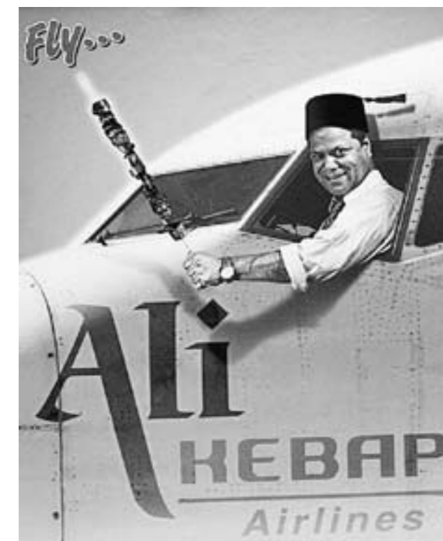
Türkische Väter sind für mehr als nur Klischees gut.

Als erster Schritt werden im Projekt Moderatoren aus unterschiedlichen kulturellen Hintergründen auf die Aufgabe