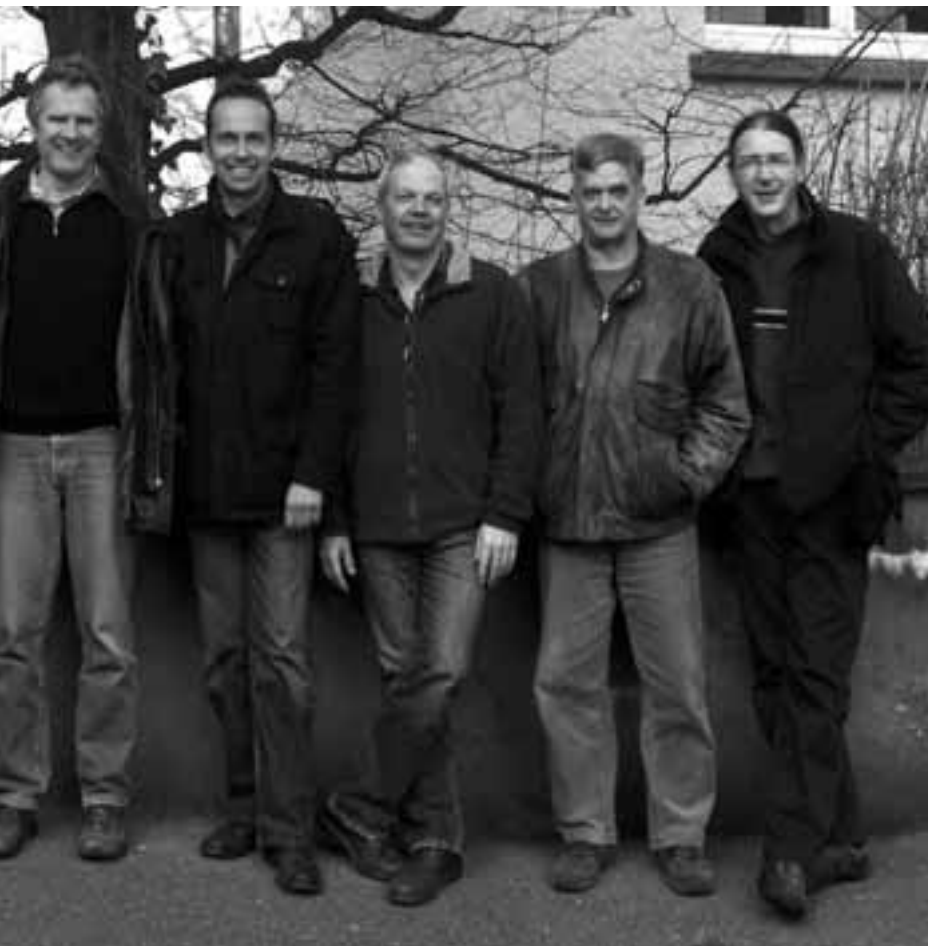
Das Männerteam von STOPPMänner Gewalt (von links):