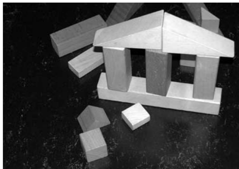
Eltern- und Väterzeit für alle: das 3-Säulen-Modell von männer.ch

männer.ch fordert ein Eltern- und Väterzeithaus, das auf allen drei Säulen steht. Mit welcher Säule der Bau begon-